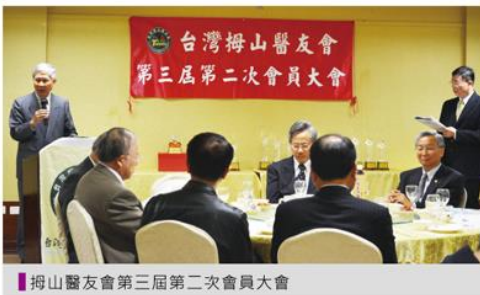
■拇山醫友會第三屆第二次會員大會

然而內政部規定更改，使第三屆第二次會員大會有了突破的契機—經過熱烈討論，所有會員通過了「台灣北醫醫學系醫友會」的命名。一方面讓北醫醫學系的校友們，更清楚地理解「娘家」的概念；另一方面，對於北醫三院中奮鬥不懈的醫療同仁，以及從台大、陽明、國防...等校來援的醫療教師們，「醫友會」的大家族概念，表示所有校友對「北醫同仁」的感謝與支持。